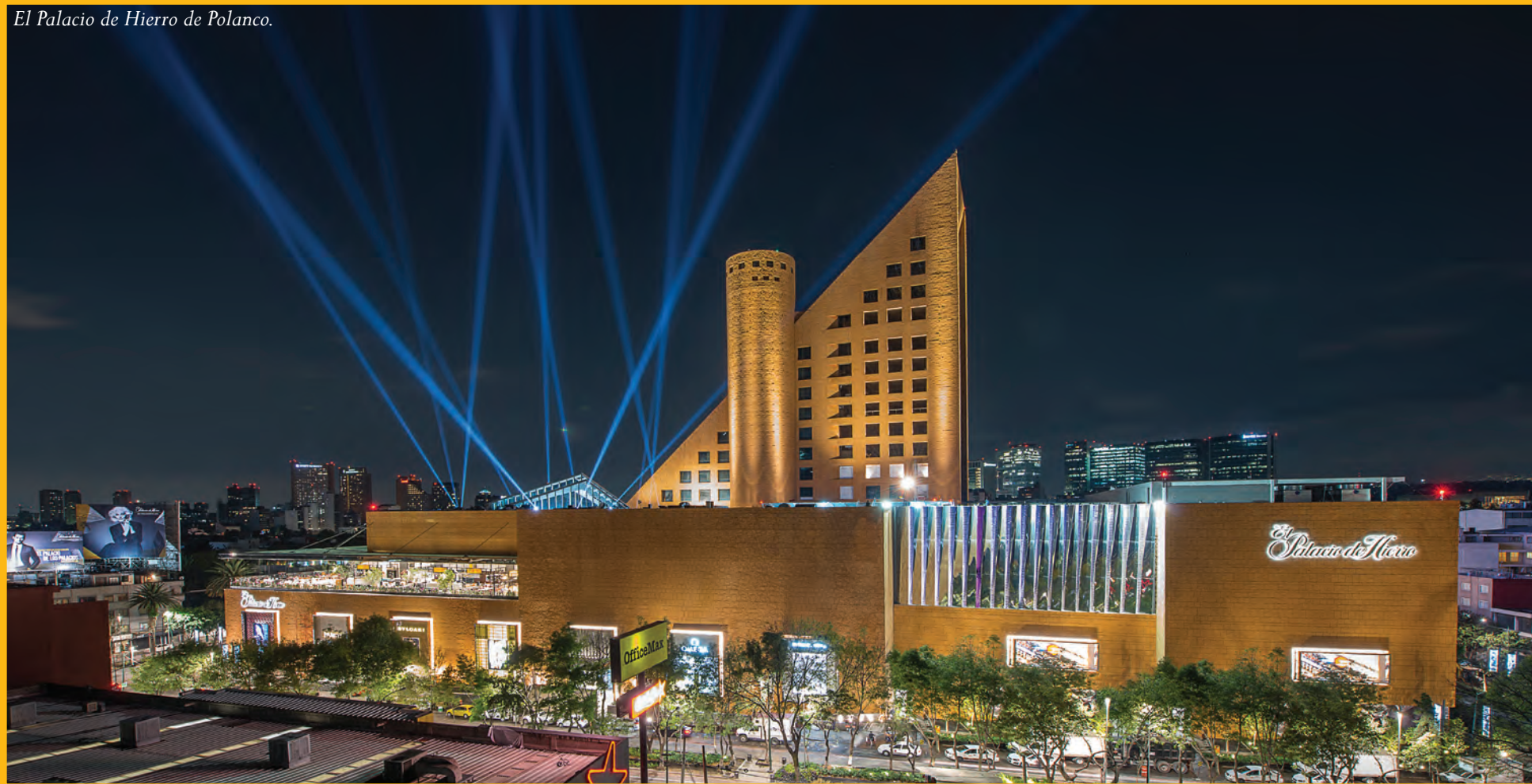
El Palacio de Hierro de Polanco.