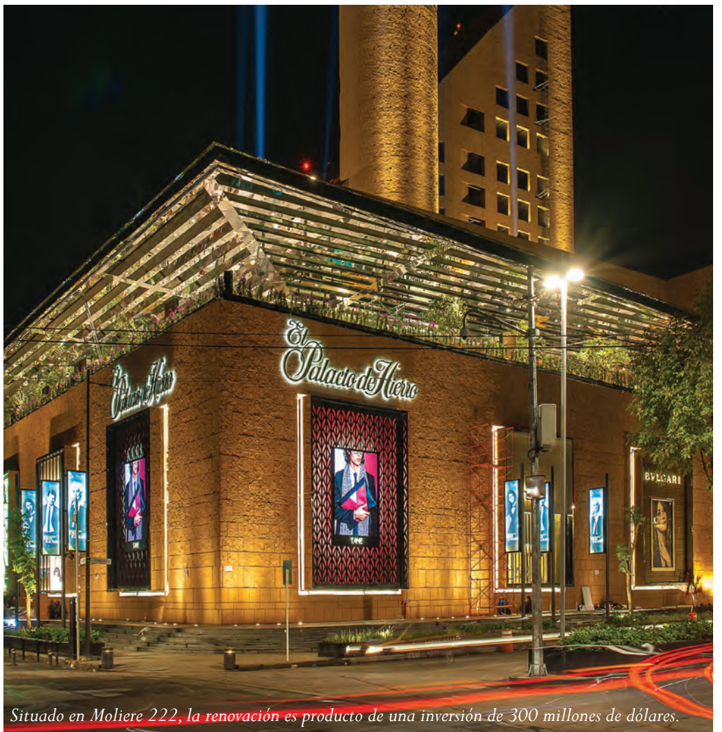
Situado en Moliere 222, la renovación es producto de una inversión de 300 millones de dólares.

Conformado por una fachada piramidal desarrollada —nuevamente— por Sordo Madaleno, y los interiores bellamente ejecutados por los despachos Architecture y Gensler, el sitio promete convertirse en la mejor experiencia de compra en Latinoamérica gracias a la planeación de espacios cargados de hospitalidad, mientras que módulos de Concierges y Anfitriones Palacio estará