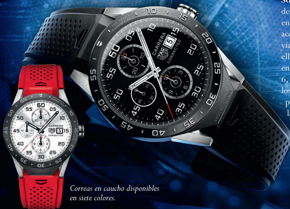
Correas en caucho disponibles en siete colores.

Swiss Engineered: si bien caja y estructura son suizos, su corazón es producto de la innovación y tecnología de Intel y del software de Google, dejando en claro que la unión hace la fuerza, y abriendo posibilidades futuras entre este trío de gigantes. ⚙️