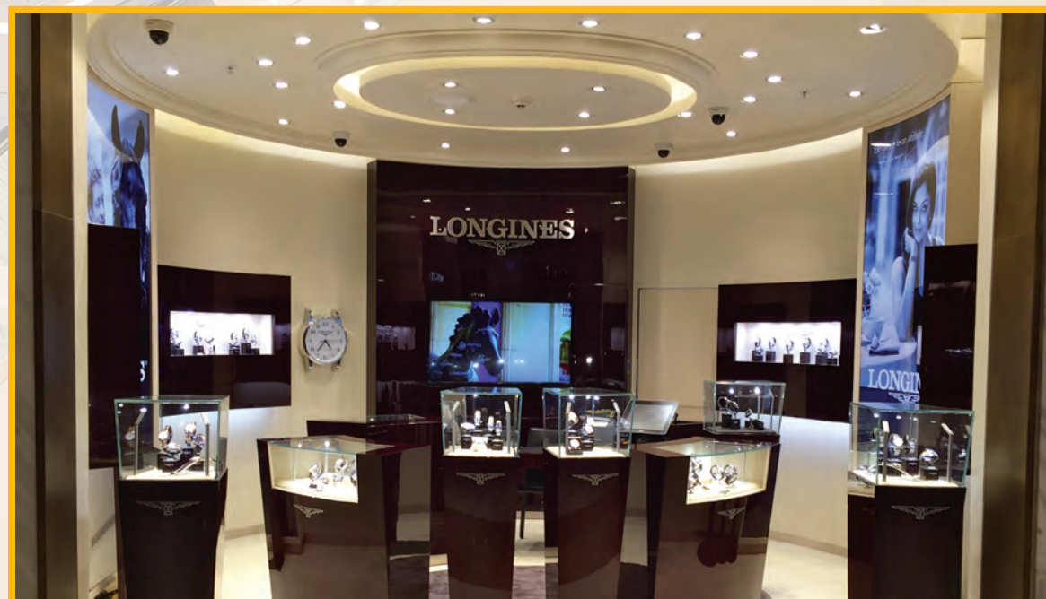
Longines: la primer boutique corporativa en México. Sus 29 m 2 de extensión exhiben un diseño apegado a los lineamientos de las tiendas internacionales. Todos los muebles, piso y luminarias fueron importados desde Europa para cumplir con los estándares de calidad e imagen.