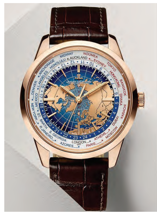
Jaeger-LeCoultre Geophysic® Universal Time.