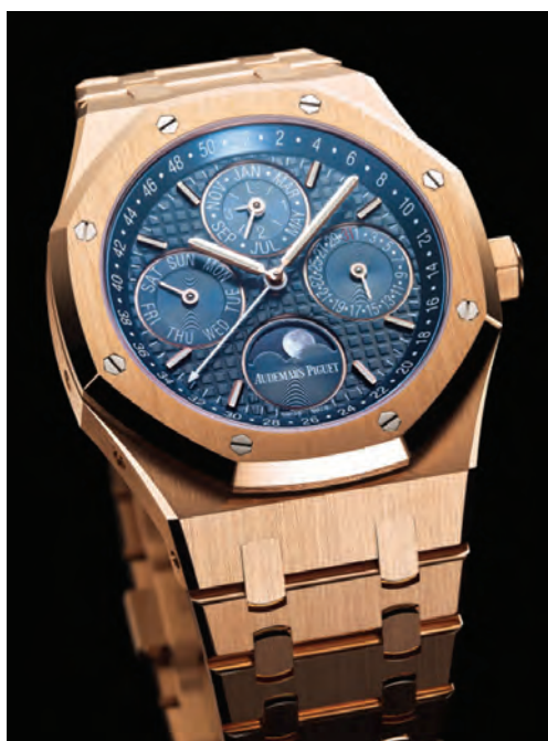
Audemars Piguet Royal Oak Perpetual Calendar.