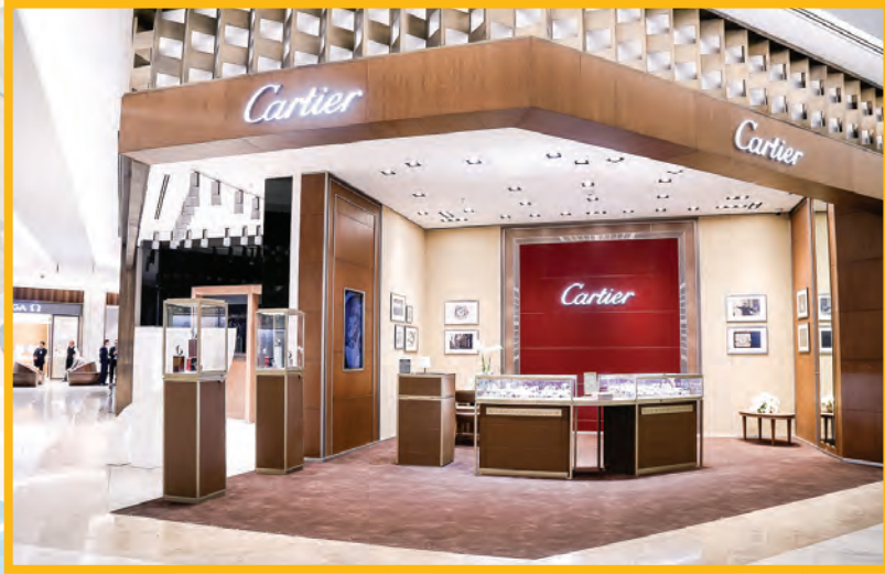
Cartier: se muestra con todo su esplendor y selección de producto.