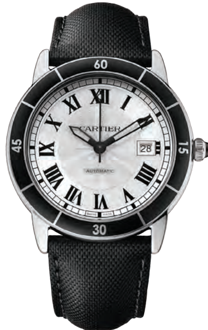
Ronde Croisière de Cartier.