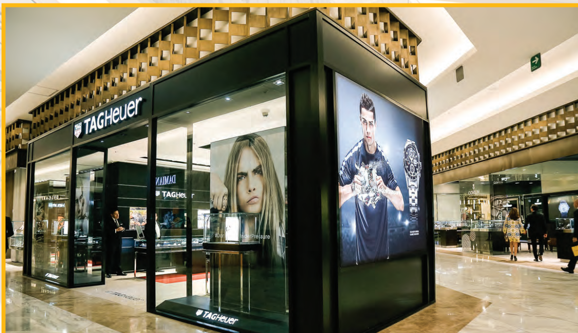
TAG Heuer: su extensión es de 63 m 2 , construido bajo un concepto de diseño unificado basado en cuatro pilares: deporte, estilo de vida, arte y herencia, cada uno de éstos se transmite a través de las diferentes colecciones de la Casa, mientras que su eslogan y mentalidad #DontCrackUnderPressure se respiran en el ambiente.