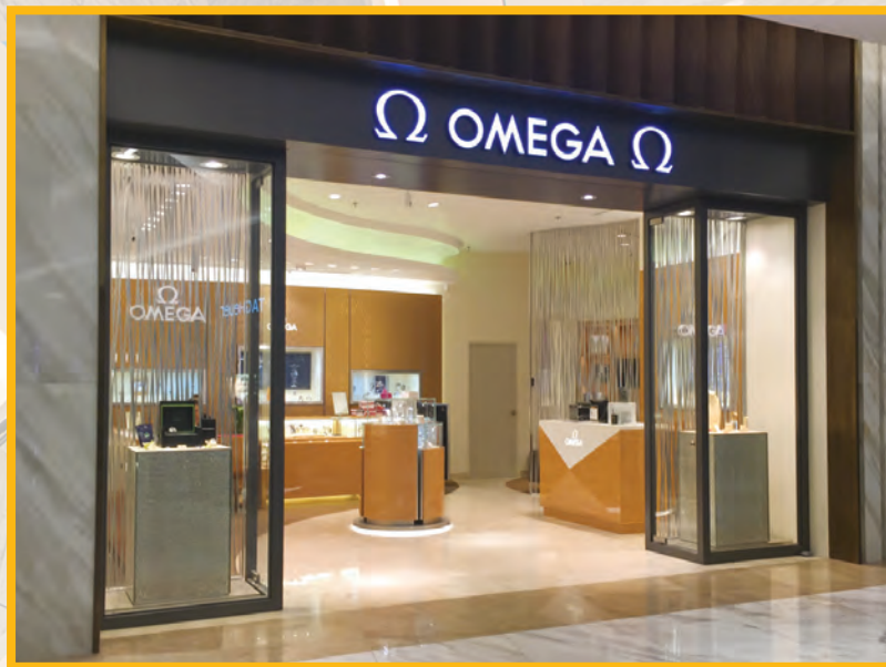
OMEGA: posee 65 m 2 de área de exhibición. Los muebles y vitrinas están contruidos en maderas claras que replican el ambiente de la marca desarrollado en 2006 y reconfigurado a partir de 2013 por un despacho japonés. Está inspirado en elementos claves como el Sol, las nubes, la lluvia y la tierra.