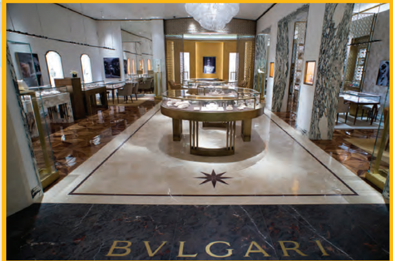
Bvlgari: 175 m 2 y bajo el nuevo concepto de la Via Condotti, boutique insignia situada en Roma, la cual replica la majestuosidad de la Ciudad Eterna.