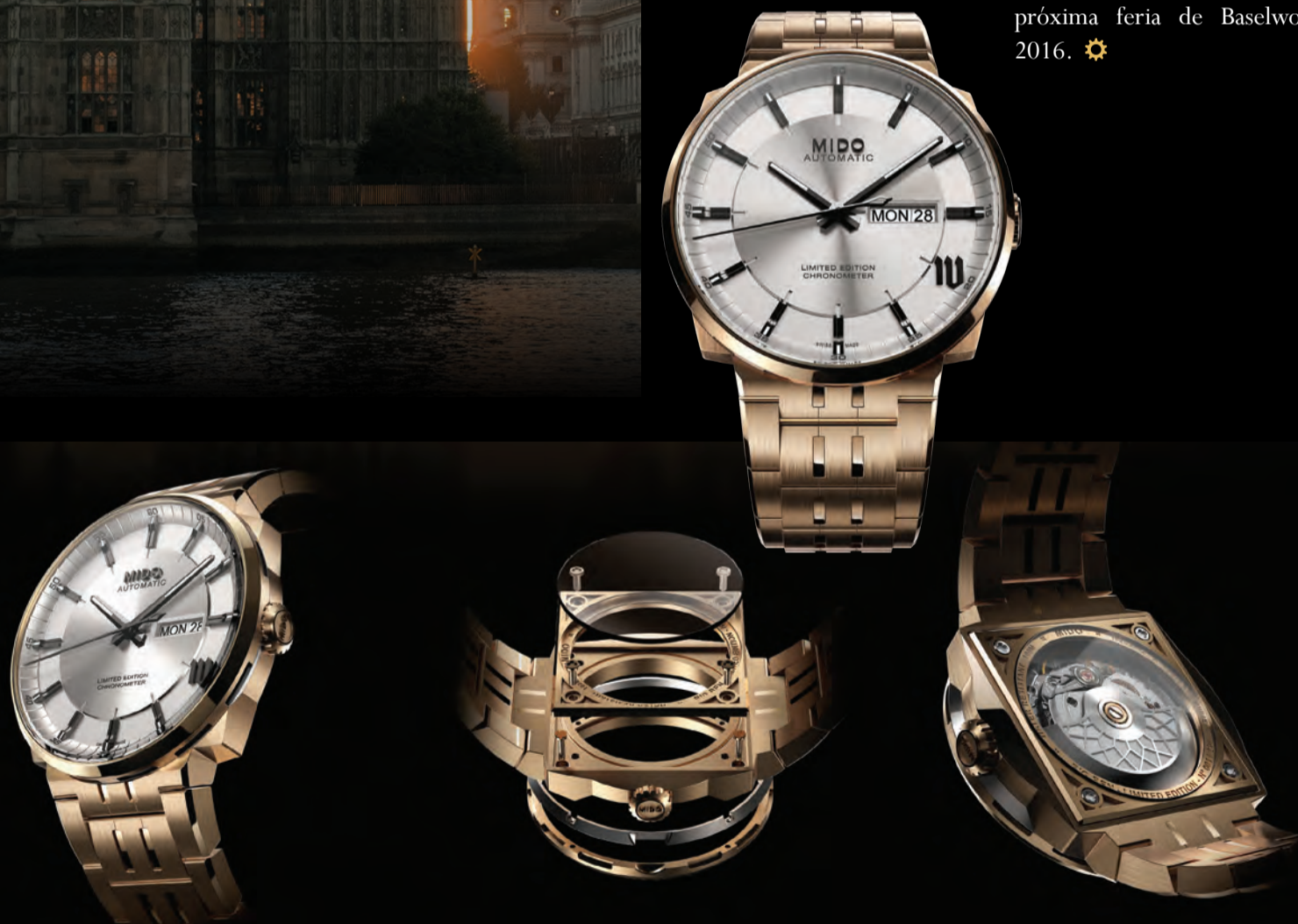
Solo se harán 500 ejemplares del MIDO Big Ben Limited Edition.