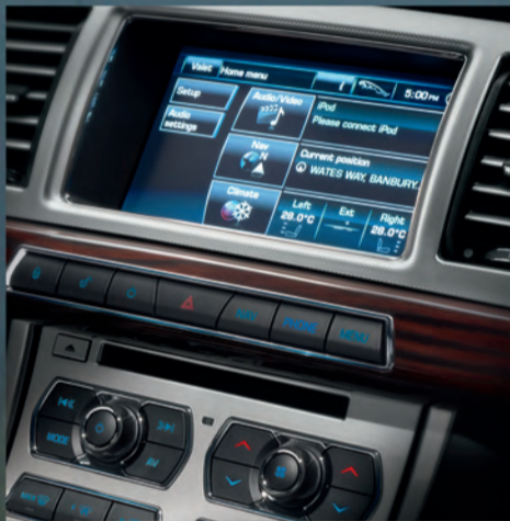
Pantalla táctil a color.