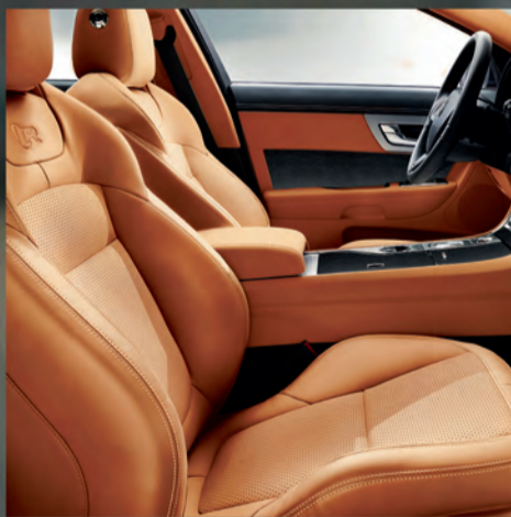
Materiales artesanales con pieles finas y maderas genuinas.