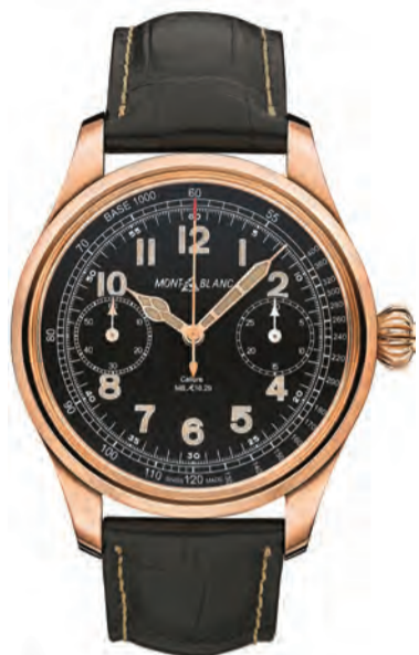
De México para el mundo: Montblanc 1858 Collection