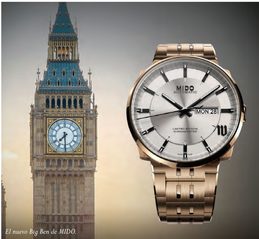
El nuevo Big Ben de MIDO.

Con Shanghai como marco de presentación, y el resto del mundo como alcance de la cobertura... El desenlace del concurso de diseño relojero anunciado por MIDO en marzo de este año, cumplió los pronósticos y superó las expectativas. Diseño es una palabra fácil de pronunciar, pero difícil de definir, debido a que la visión del artista es subjetiva; podrá gustar a una persona y ser perfectamente congruente para un cúmulo de aficionados, pero quizá para otros no lo sea. Cuando hablamos de diseño de producto se debe acudir a los mejores, y así lo dispuso la marca de relojería fundada por Georges Schaeren en 1918, hoy ubicada en Le Locle, en el Jura suizo. Hace apenas un par de semanas nos “embarcamos” rumbo al Oriente para conocer el alcance de una firma sumamente apreciada en nuestro país gracias a su calidad y a la estética de sus productos. MIDO es firme y fiel a su esencia, que se basa en las líneas de los monumentos