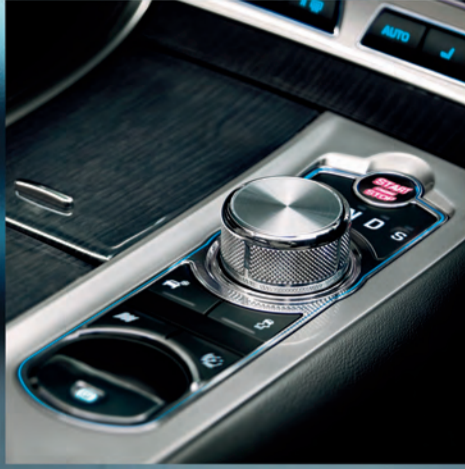
Perilla de velocidades Jaguar Drive Selector™.